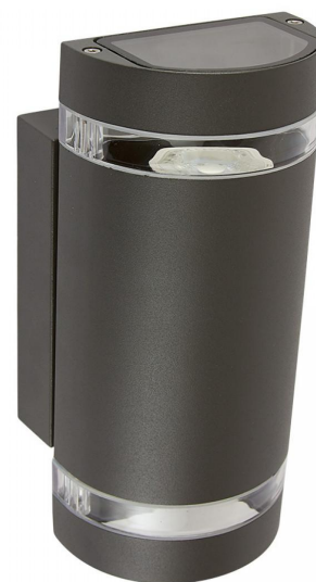
Textura de Luz